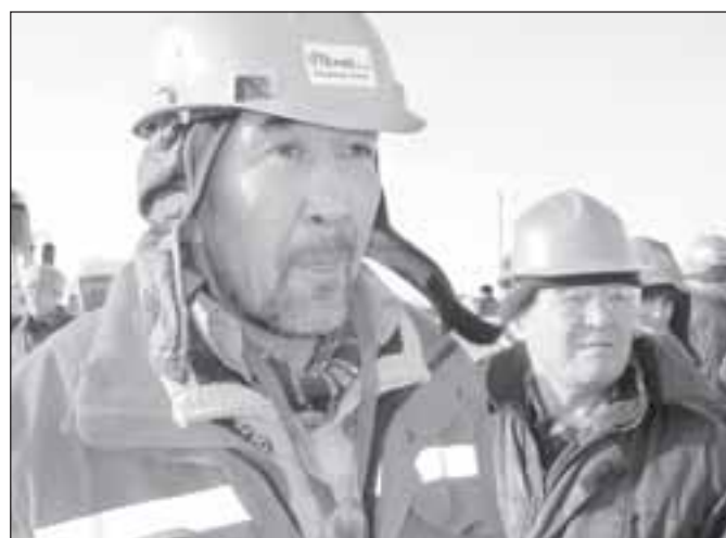
В качестве главного аргумента за отстранение руководства Agip КСО от управления проектом акимат Атырауской области назвал недовольство рабочих, вылившееся в акцию протеста.

В качестве подтверждения своего мнения анонимный автор напоминает, что в октябре текущего года в Астане было принято решение о создании единой операционной компании North Caspian Operating Company (NOC) по управлению проектом Кашаган, работа которой по планам Астаны должна начаться уже в 2009 году.