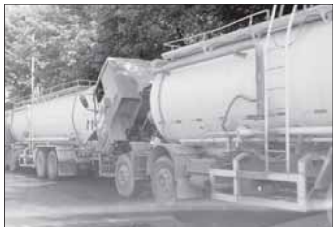
Пограничник, несущий службу на границе с Китаем, за ускоренное продвижение транспорта на территории Казахстана с каждой автомашины с грузом берет 12 тысяч тенге. И это ни для кого не секрет!

Отдельная проблема – это качество наших дорог, не позволяющее зачастую доехать плодоовощную продукцию до пункта назначения в надлежащей сохранности и свежести. К примеру, от города Аягуз до порта Семей грузовой транспорт движется со скоростью 20 км в час в течение 12 часов, настолько она разбитая, настолько она разбитая. Хотя транспортный и дорожный налоги аккуратно выплачиваются. Это также накладывает дополнительную копейку на плодоовощную продукцию.