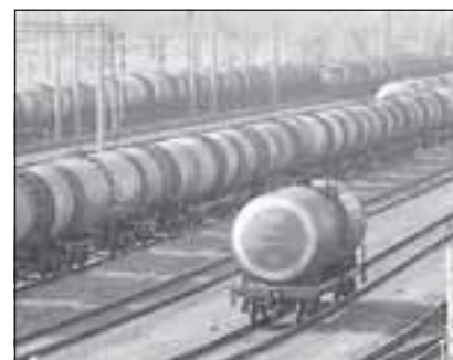
Цена $70 за баррель выгодна и производителям, и потребителям, считают крупные производители нефти.

Что касается мировой экономики, то г-н Буньков уверен, что она «оживет» во второй половине следующего года. Это будет связано с тем, что в антикризисными мерами, которые принимали и принимают мировые правительства, и прежде всего США. Российская же экономика будет двигаться в рамках общемирового сценария.