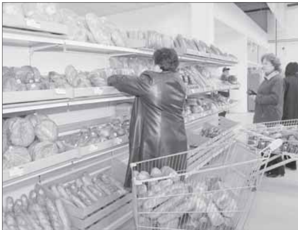
Мукомолы тоже почувствовали на себе уменьшение цен на зерно. Тем не менее считают, что для снижения цен нужно решение об открытии экспортных границ и... отсутствие конкурентов.

Сельхозпроизводители ждут весеннего повышения цен, чтобы продать зерно с наименьшими для себя потерями