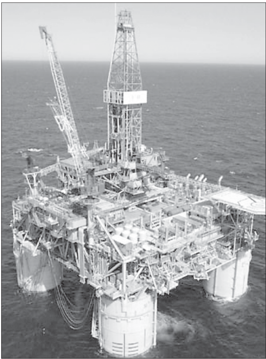
Со времени начала освоения нефтяных залежей шельфа экологи наблюдают уже четвертый или пятый массовый падеж морской живности. По их мнению, разведочные работы на Каспии вполне в состоянии обеспечить такой объем выбросов нефтепродуктов и химических веществ, который приведет к полной гибели всего живого во всем Каспии.