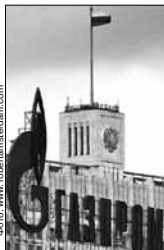
Неужели в России нет пеленгаторов, которыми располагает Agence Nationale des Fréquences? Это тогда уже не шурприз, а грандиозный скандал!

Очередной «жертвой» спутникового терроризма стала немецкая Deutsche Welle, но специалисты быстро нашли источник «глушилки»