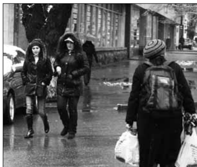
Индекс качества жизни в Казахстане составил всего лишь 48 баллов, тогда как у России 54 балла, Литвы – 73, а Франции – 82.