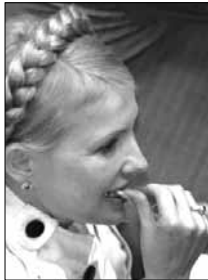
Заслугу за «мирный» газник не могут поделить между собой два бывших верных союзника. Премьер-министр Юлия ТИМОШЕНКО по долгу службы официально обеспечила декабрьские газовые выплаты России, но Виктор ЮЩЕНКО уверяет, что деньги в разоренной государственной казне «наскреб» не премьер, а президент.

Казалось бы, оба поддерживают один и те же цели: европейскую интеграцию Украины, независимость страны от «большого брата» – России. Казалось бы, у обоих один и тот же противник – «регионал» Виктор Янукович, за плечами которого, как и пять лет назад, незримой маячит тень