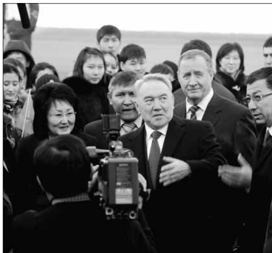
По информации АР в докладе не называются конкретные имена замешанных в сделке казахстанских чиновников.