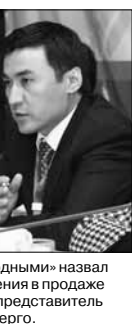
«Абсурдными» назвал обвинения в продаже урана представитель Минэнерго.

Во-вторых, Таджикистан граничит сразу с несколькими «большими точками» – и Афганистан, и Синьцзян-Уйгурский район Китая, где в прошлом году для подавления беспорядков потребовалось вмешательство армии, и Ферганская долина, что делает страну идеальным плацдармом для дестабилизации