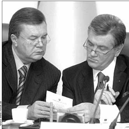
Действующий глава государства, по прогнозам социологов, может рассчитывать примерно на 4% голосов.

вом туре, как утверждали социологи, – так называемый кандидат «против всех».