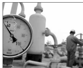
«Газпром», похоже, готов поступиться прибылью, но сохранить поставщика.

Понятно, что такая перспектива не может не тревожить «Газпром». Спрос на газ рано или поздно вырастет, и без центральноазиатского газа выполнять взятые на себя обязательства по поставкам снова станет затруднительно. Лучше уж сейчас немного переплатить, чем потом остаться без поставщика.