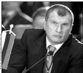
По данным Игоря СЕЧИНА, Москва сегодня поставляет Минску 21 млн тонн нефти в год по трубам и еще примерно 4-5 млн тонн по железной дороге.

В этой ситуации, по мнению эксперта, для Минска было бы логичнее продолжать торговаться, нежели делать столь категоричные громкие заявления, в которые все равно никто не поверит. В том, что эпатирующие высказывания белорусского лидера – это лишь способ торговли, похоже, никто уже не сомневается.