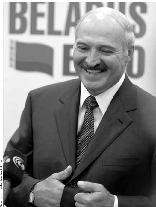
По мнению наблюдателей, Александр ЛУКАШЕНКО в очередной раз решил сыграть в свою излюбленную игру – предявить партнеру ультиматум в самый неудобный для того момент.