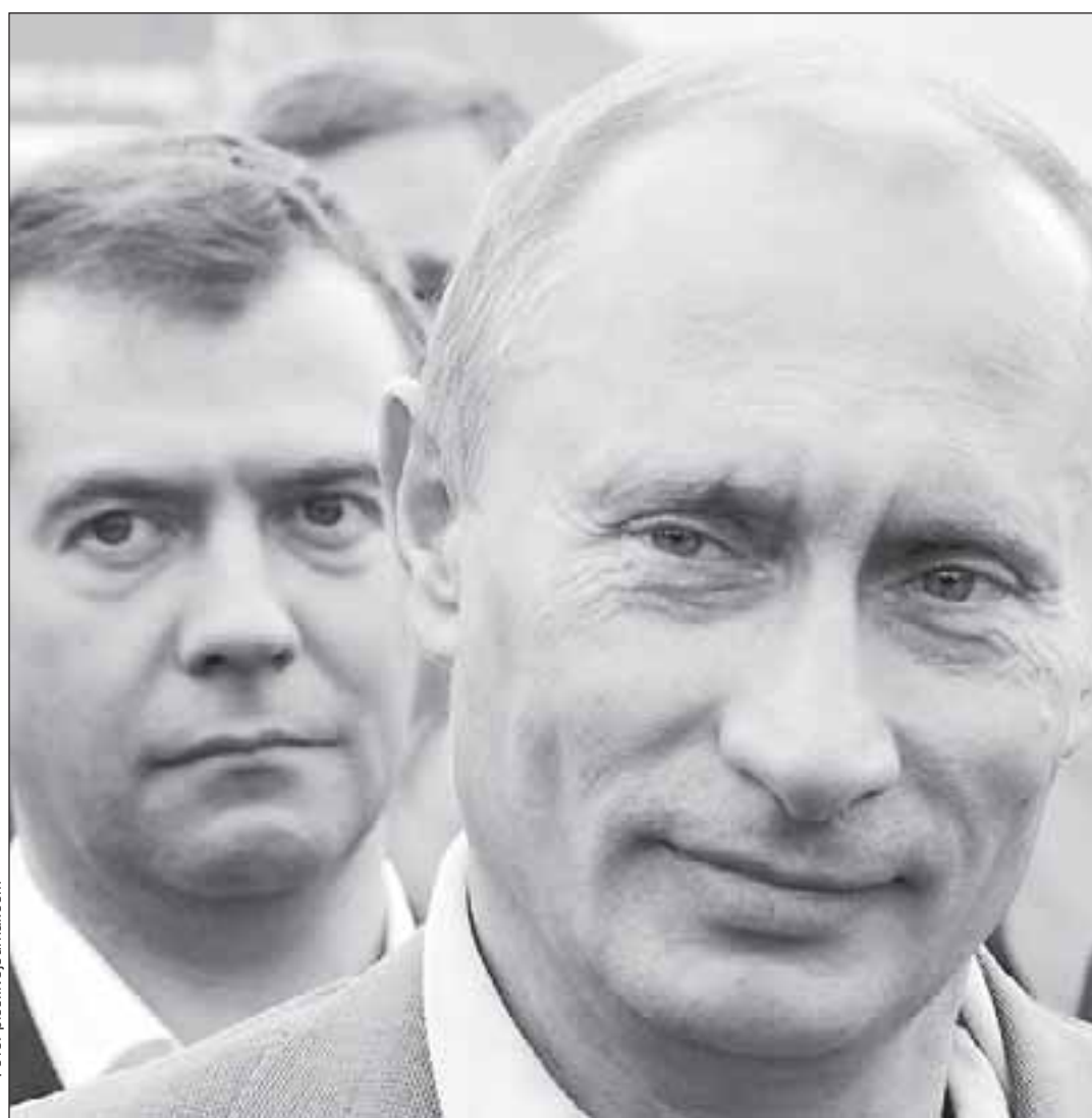
Знал ли Владимир ПУТИН о предложениях Медведева? Во время трансляции послания президента Федеральному собранию было заметно, что происходит нечто незнакомое ВВП.

лизму. Но он может быть использован и против Путина, так как в любом случае будет означать сокращение влияния контролируемого им правительства в регионах через сокращение как раз той части бюрократии, которая работает с ним непосредственно.