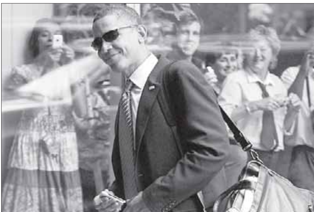
За время прошедших выборов американский народ показал главное: каким бы сильным ни был экономический кризис, какие бы глобальные формы он ни принимал, он ни в коем случае не отменяет демократии, выборов, реализации всех конституционных прав и свобод американцев.