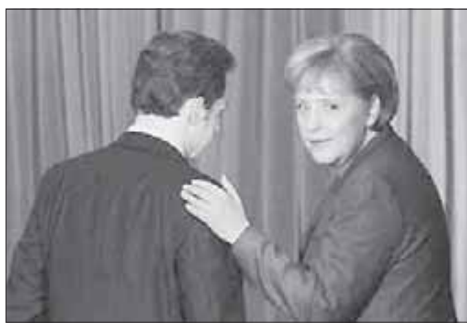
Николя САРКОЗИ одним из первых поздравил американского коллегу с победой, а вот Ангела МЕРКЕЛЬ отморозилась.

По мнению экспертов, «совместная работа» вполне может означать нечто, похожее