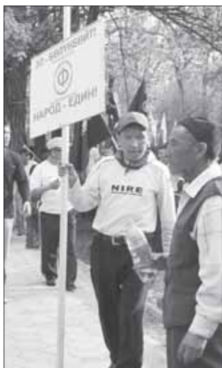
Создание конституционного строя, где ни одна политическая сила не могла бы монополизировать власть, – основная цель новой коалиции.