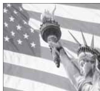
Показателем силы американской демократии назвал сам Барак ОБАМА свою победу на выборах.