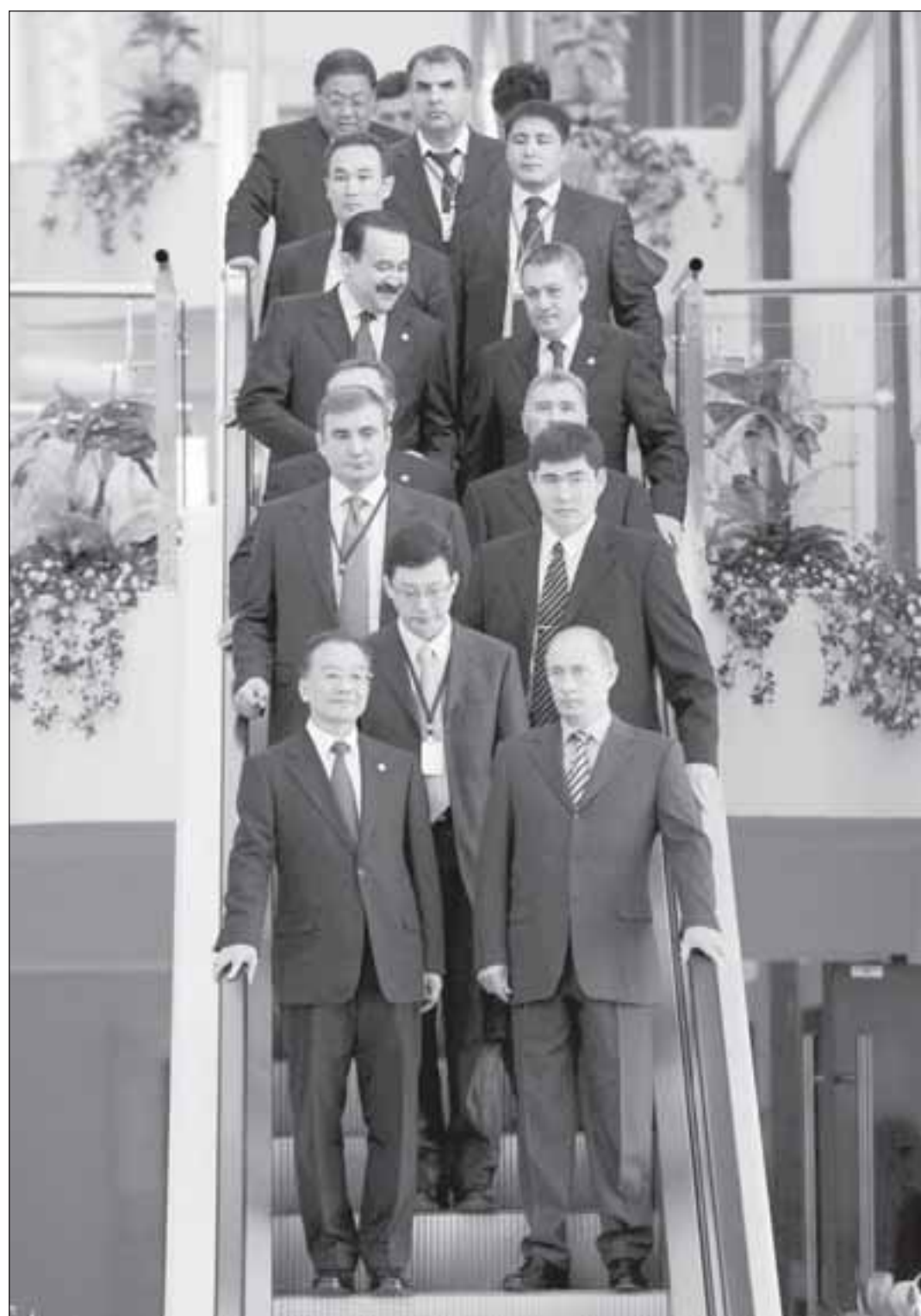
Мировая финансовая архитектура, построенная на американском долларе, стала основной мишенью Владимира ПУТИНА на заседании ШОС. Россия готова для «формирования многополярной финансовой системы» предложить свою валюту.

Кроме того, российский эксперт полагает, что надо четко понимать – единое экономическое пространство с Западом в энергетическом секторе не получится. Нынешний финансовый кризис показал: стремление постсоветских стран полностью