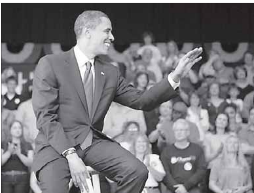
Большинство казахстанцев – участников акции «Инсценированные выборы президента США» отдали свои голоса за Барака ОБАМУ. По информации КазТАГ, более 200 голосов в 11 городах Казахстана было отдано за республиканцев и 966 проголосовало за демократов. Проект был организован посольством США в Астане и офисом ЮСАИД в Алматы.

Кандидат от демократической партии одержал сокрушительную победу на президентских выборах в США