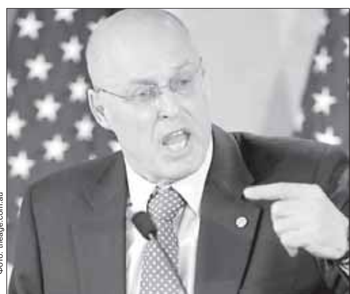
Министр финансов США уже успел поупражняться в обходительности по отношению к Китаю и даже высказал надежду, что «Китай сможет извлечь урок из ошибок Америки». Звучит не слишком убедительно, однако сам Генри Полсон, похоже, в свои слова верит.

Так или иначе, но факт остается фактом: позиции Китая на сегодня гораздо прочнее, чем у любой другой страны Запада. Кризис заденет КНР, но не так сильно, как других. Китайский премьер Вэнь Цзябао прибыл на конференцию в Вашингтон в качестве главного кредитора Америки. Так что теперь то, что имеют сказать китайцы, – будет услышано со вниманием.