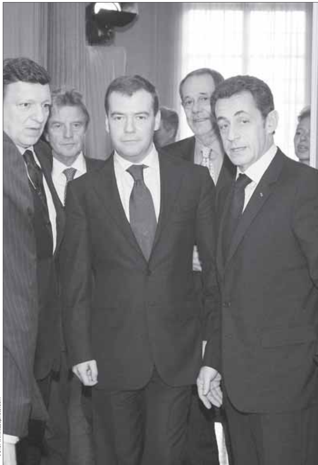
Дмитрий МЕДВЕДЕВ возлагает большие надежды на нового американского президента – с его помощью кризис доверия между Россией и США может быть наконец преодолен.

Вот что услышала американская аудитория и что заста-