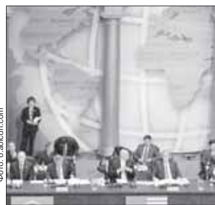
Лидерам стран «Двадцатки» на саммите в Вашингтоне удалось выработать единую позицию по основным пунктам повестки.