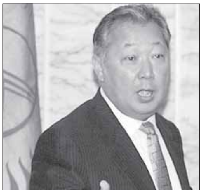
Кыргызская оппозиция дала Курманбеку БАКИЕВУ время для размышлений до 20 декабря.

Кстати, по информации Союза мусульман, это новобранное движение намерено провести массовые акции протеста в Бишкеке уже 16 декабря. Устроители выступают против экономической и кадровой политики Курманбека Бакиева. Так что Кыргызстан ожидает в уходящем году весьма «жаркий» декабрь.