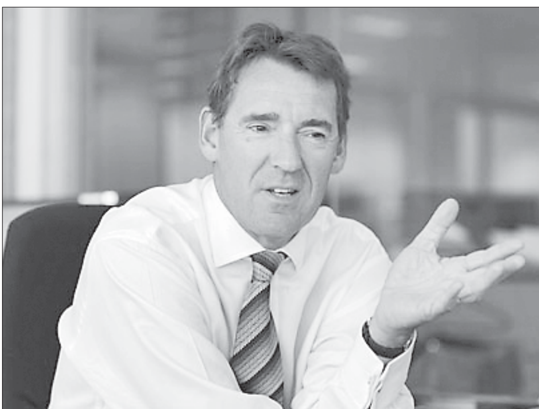
Джим О'Нил уверен, что жители стран БРИК способны поддержать мировую экономику уже только тем, что будут продолжать тратить свои деньги и таким образом подпитывать мировых производителей товаров и услуг.

Экономисты «великолепной четверки» оказались гораздо лучше подготовлены к нынешним потрясениям, чем европейские государства