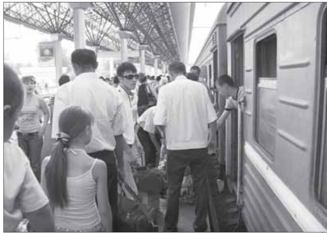
В первую очередь в России ждут именно высококлассных специалистов – только они могут рассчитывать на обеспечение жильем за счет приглашающей стороны.