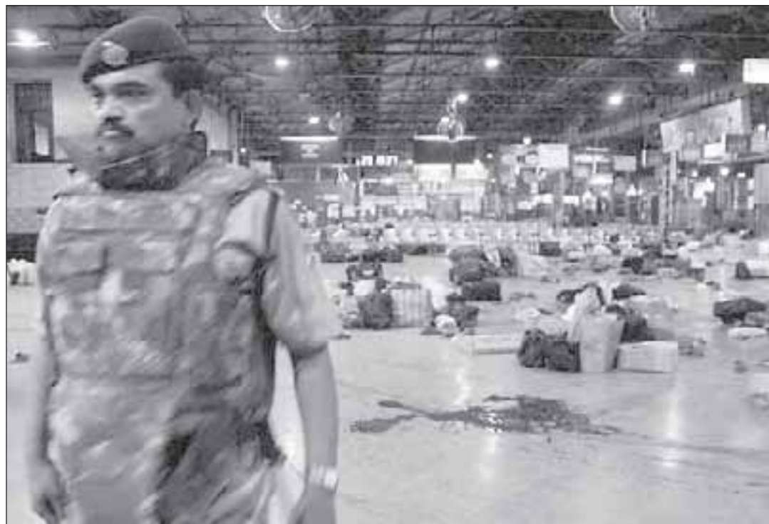
Индийские спецслужбы показали всему миру свою беспомощность перед лицом внешней опасности. Усвоят ли этот печальный урок власти этой страны?

лую серию взрывов. Впрочем, целью этих людей являются не только мусульмане — минувшим летом они провели серию насильственных акций против христиан в городах Орисса и Карнатака.