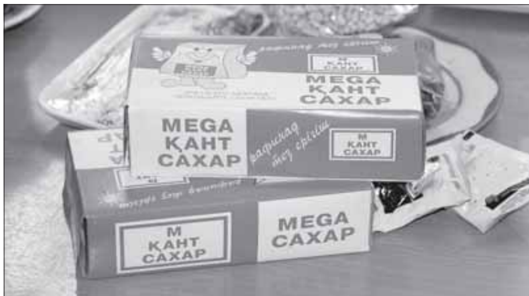
По некоторым странам и группам товаров казахстанской стороне приходилось извращиваться. Например, с кубинцами меняли сахар на табак и алкоголь, чтобы договориться о ставках, защищающих казахстанских производителей белого сахара.