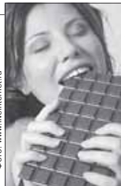
В ход пошли даже знаменитые швейцарские часы, на которые, кстати, ввозная пошлина будет снижена, но зато подорожает импорт не менее известного швейцарского сыра и шоколада.

отечественных ветеринарных и санитарных норм в соответствии с международными стандартами, что является ключевым условием для конкурентоспособности казахстанской мясной продукции. Для этого в стране уже созданы сеть современных ветеринарных и санитарно-эпидемиологических лабораторий, до 2012 года их планируется открыть 126 в разных регионах страны. Вместе с подготовкой кадров это направление обойдется бюджету в 16 миллиардов тенге.