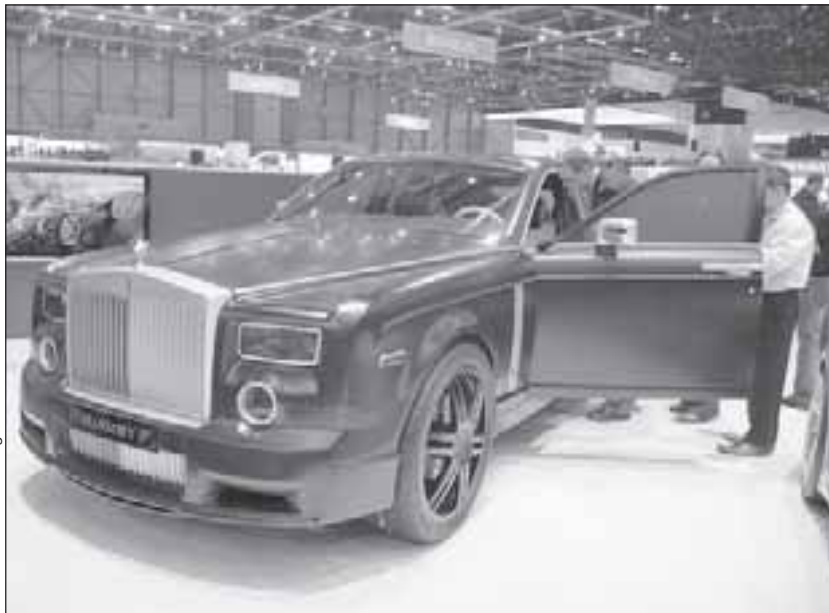
Кризис решил испытать автопроизводителей дорогих машин на прочность, и пока результаты неутешительные.

Нынешний кризис вновь испытывает производителя премиум-марок на прочность. Стоит отметить, что за 95 лет существования в Aston Martin двенадцать раз менялись владельцы и трижды компания оказывалась в состоянии банкротства. При этом пока-