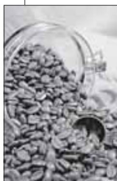
Бразилия в обмен на либеральные условия экспорта в Казахстан кофе согласилась с предлагаемым уровнем таможенных пошлин на импорт мяса.