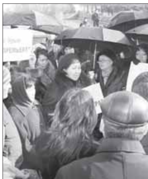
В Грузии были розы, в Кыргызстане – тюльпаны, а в Казахстане – возможно, будут черные зонтики...

Впрочем, вскоре силы правопорядка пришли в себя и попытались по уже ранее заведенной «традиции» препроводить наиболее активных участников несанкционированного мероприятия в подогнанный к монументу автобус. Но... случилось невероятное.