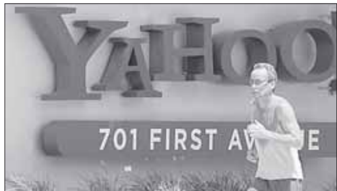
Интернет-компания Yahoo! обесценилась вследствие кризиса на 60%, однако покупателей на нее все равно нет.

Лучше, что сейчас может сделать преемник Янга, по мнению экспертов, кем бы он ни оказался, – это все-таки продать поисковик Microsoft'у и пустить остальной бизнес Yahoo! в свободное плавание. Во всяком случае, хуже точно не будет. Как говорит аналитик FT Ричард УОТЕРС, «бумаги Yahoo! должны остановить падение в какой-то точке, хотя ставить состояние на это я бы не рискнул».