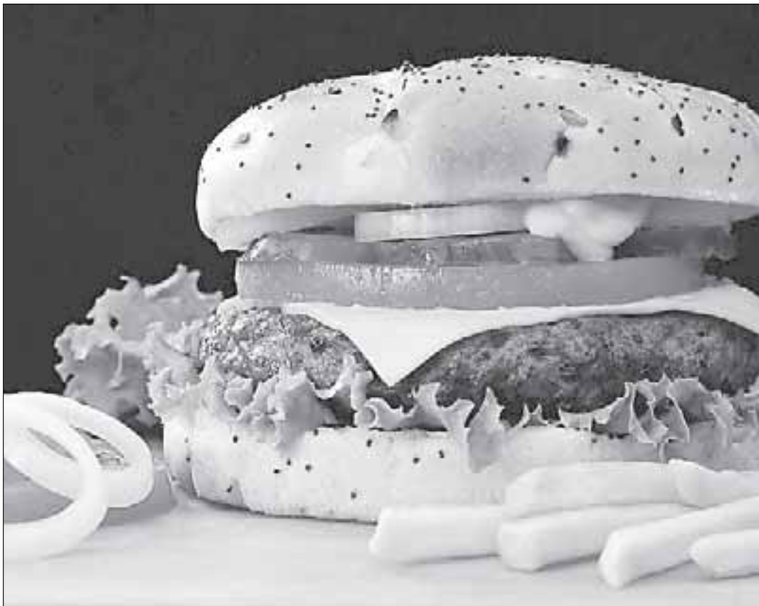
Судя по комментариям независимых аналитиков, в России фастфуд еще долго останется на плаву, в отличие от фешенебельных ресторанов.