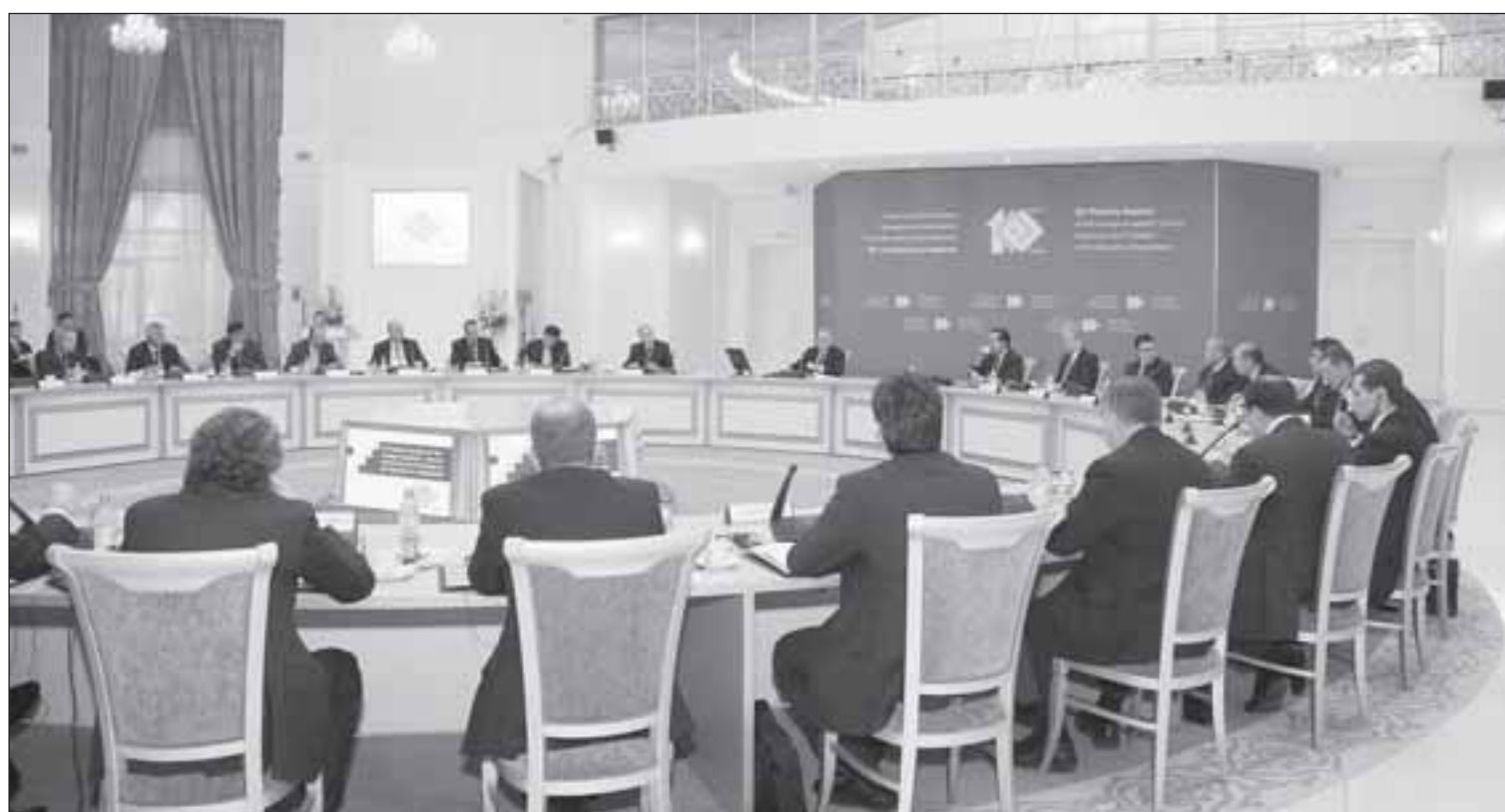
Тема «казахстанского содержания» в проектах, реализуемых с участием зарубежного капитала, проходила красной нитью через все заседание Совета инвесторов. Среди главных проблем было отмечено отсутствие единой методологии в определении понятия, а также единой методики расчета казахстанского содержания в контрактах.

Довести уровень казахстанского содержания в иностранных компаниях до 50% потребовал от правительства глава государства