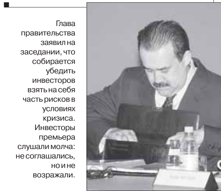
Глава правительства заявил на заседании, что собирается убедить инвесторов взять на себя часть рисков в условиях кризиса. Инвесторы премьера слушали молча: не соглашались, но и не возражали.