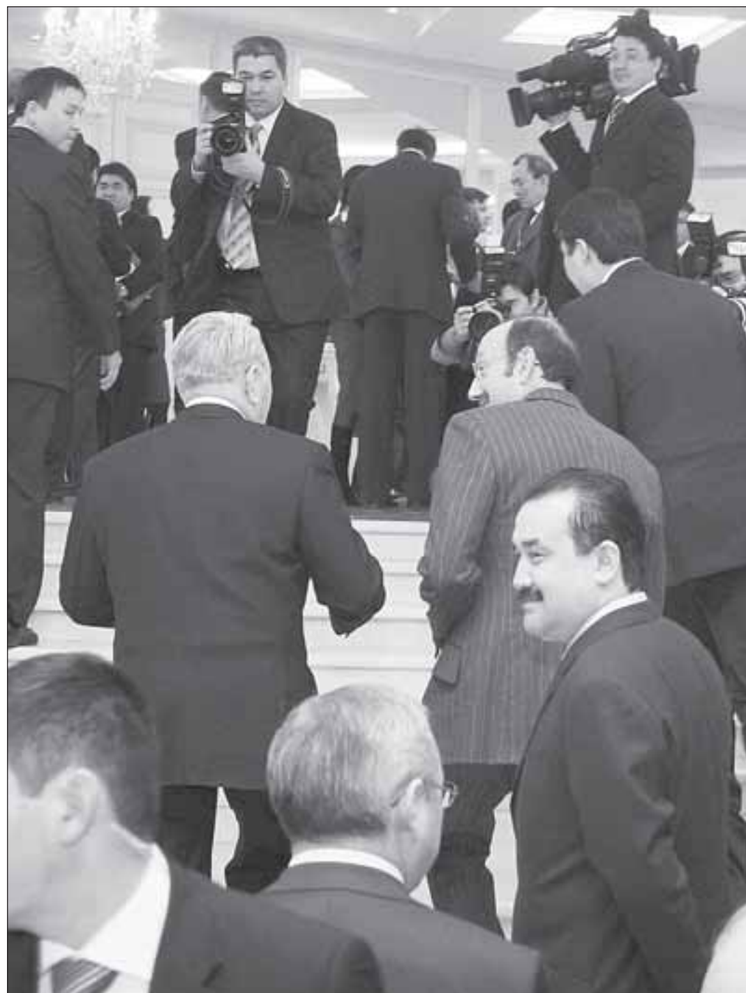
Почему в Норвегии и Великобритании доля местного содержания в проектах с иностранным участием составляет от 50 до 80%, а у нас не более 30%, а чаще 10 – 15%, задался вопросом на Совете инвесторов президент. Как выяснилось, правительство этой проблемой просто добросовестно не занималось.

Довести уровень казахстанского содержания в иностранных компаниях до 50% потребовал от правительства глава государства