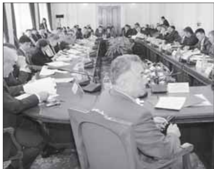
Незначительное повышение цен предусмотрено только для «простого» населения. Тарифы для юридических лиц вырастут в 10 раз.

Но, как оказалось, незначительное повышение цен предусмотрено только для «простого» населения. Тарифы для юридических лиц вырастут в 10 раз.