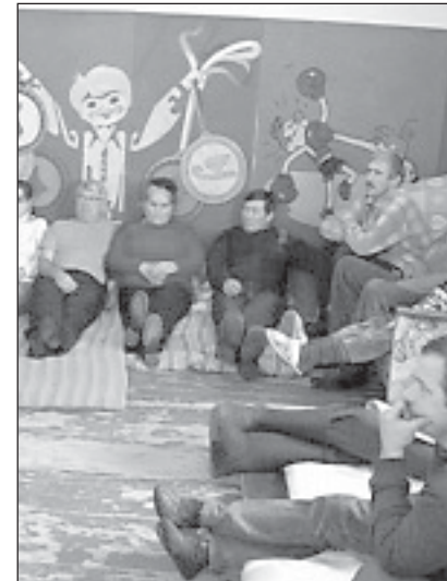
Голодовку рабочие намерены проводить бессрочно, до полного погашения долгов по зарплате. В их адрес уже поступили телеграммы солидарности из России и других стран.

Бывшие работники Иртышского химико-металлургического завода продолжают голодовку, требуя выплатить им зарплату