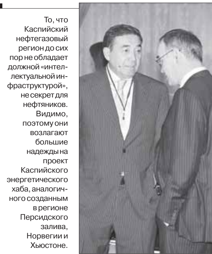
То, что Каспийский нефтегазовый регион до сих пор не обладает должной интеллектуальной инфраструктурой, не секрет для нефтяников. Видимо, поэтому они возлагают большие надежды на проект Каспийского энергетического хаба, аналогичного созданному в регионе Персидского залива, Норвегии и Хьюстоне.