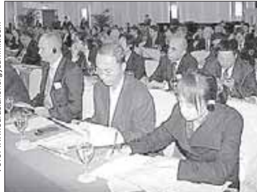
Энергия воды и ветра была в центре повестки второго дня евразийского саммита.

немного. Хотя, конечно, это 200 семей. Там более значительную роль уже играет механический завод. На заводе очень ответственный руководитель. Мы встречались, и он готов всех забрать к себе с ИХМЗ. Понятно, что на ИХМЗ высококвалифицированные специалисты, технологи. Они привыкли там работать. Есть долги по зарплате. У собственников есть интерес к предприятию. На его запуск нужно 4,5 миллиона долларов. 50% готов профинансировать Банк развития. Собственники тоже выразили такое намерение, составлен протокол. Я думаю, что завод все равно запустят. Если не запустят – будем банкротить. Когда мы заявили о банкротстве – собственники зашевелились. Они вложили немалые средства, а долгов по зарплате – 46 миллионов тенге. Отдавать предприятие им не хочется. Долги все равно они закроют, какую-то часть выплатят до Нового года.